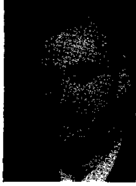
HİKMET E. DİNÇER 1925 – 1966