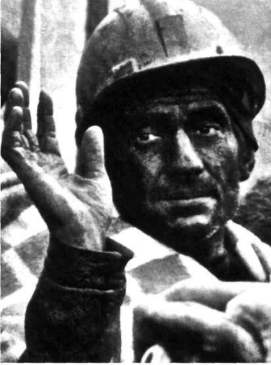
UMURSADIĞIM İNSANLARA (elektronik postayla gelen bir öykü)

Michael herkesin imrendiği biriydi. Her zaman neşeliydi ve çevresine hep olumlu şeyler söylerdi. Birisi ona nasıl olduğunu sorduğunda: "Daha iyi olamazdım" diye yanıtlardı. Doğal bir motivatördü. Eğer çalışanlardan birisi işyerinde kötü bir gün geçirmişse, Michael, ona, durumun olumlu taraflarına bakmasını söylerdi.