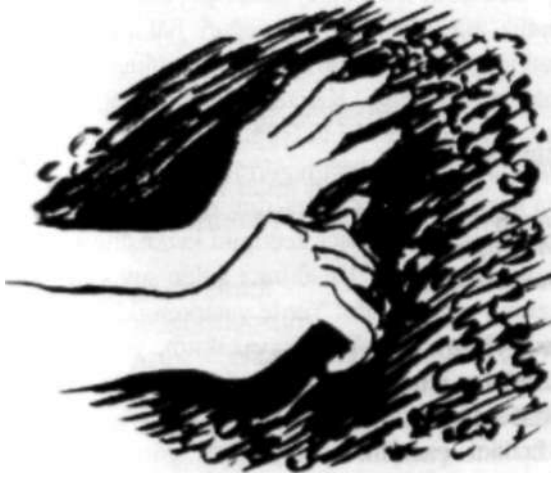
Desen: Muhittin Bilgin

karaaltın toplarız yüreğimizle unuturuz nasırlarımızı ağırlarımızı aklımız evimizde bebelerimizde yüreğimiz yeraltında ellerimizde mete alpsar