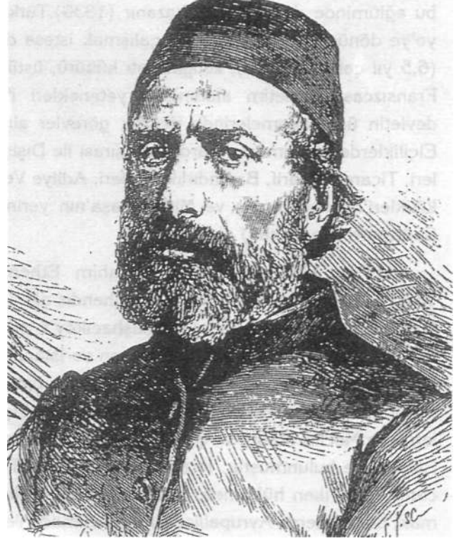
Sadrazam İbrahim Ethem Paşa

Hüsrev Paşa'nın diğer bir özelliği de padişahın saygısını kazanan, kendisine yakın, hayırsever bir devlet adamı oluşudur. Himayesine aldıkları çocukları, ileride devlete hizmet edebilecek kişiler olarak yetiştirmek onun amaçlarının başında gelmektedir. Bu maksatla dört çocuk seçer, bunları Paris'te okutmak ister. Amacını dönemin padişahı Sultan Mahmut'a açar. Bu çocukları padişaha tanı-