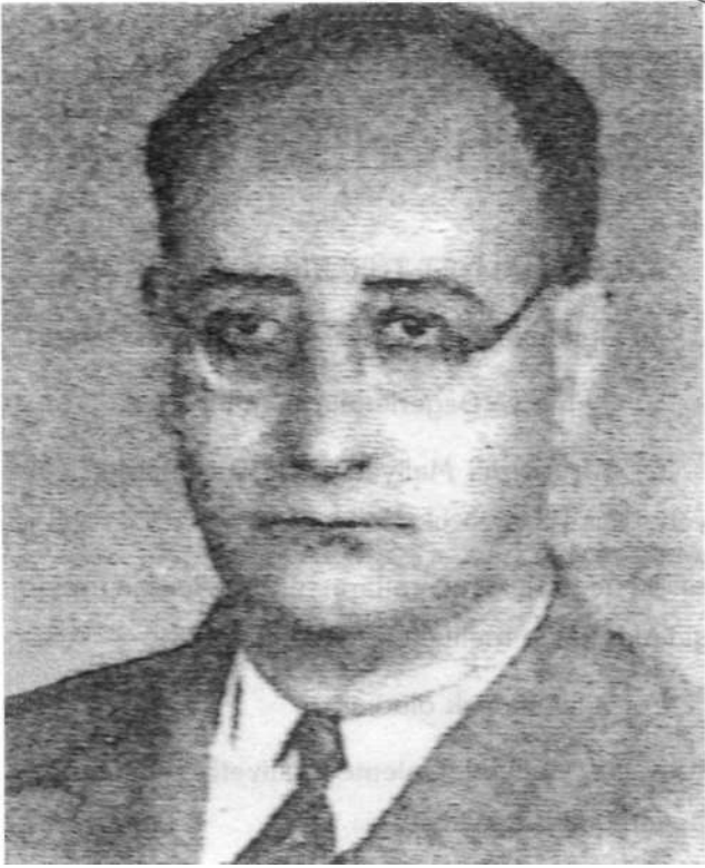
Cemal Sait BARK

uygun olarak İlmî Maadin ve Tabakatül Arz isimli bir kitap yayınlamıştır (1891). İfadesi sade, şekil ve resimleri güzel olan bu kitapta ülkemize ait örnekler ve bilgiler aktarılmıştır. Halil Ethem Bey Hochstatter'in Avrupa Türkiye'sinin Jeolojisi ve Franz Toula'nın Kocaeli jeolojisi ve maden potansiyeli üzerine yaptıkları araştırmalarda kısmen birlikte çalışmışlardır. Toula Kocaeli'nde Triyas devrine ait toplayıp tanımladığı bazı fosil türlerini, Halil Ethem Bey'in adına istinaden adlandırmıştır; (Terebratula Ethemi, Rhyconella Ethemi, Acrodiceras Halili... vs. gibi) Bu fosil koleksiyonu halen Viyana Tabiat Tarihi Müzesi'nde bulunmaktadır.