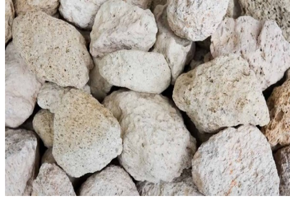
Şekil 1. Asidik Pomza ( http://www.mustafatunc.biz/pomza ).

Pomza, asidik (Şekil 1) ve bazik pomza (Şekil 2) olmak üzere iki kısma ayrılabilir.