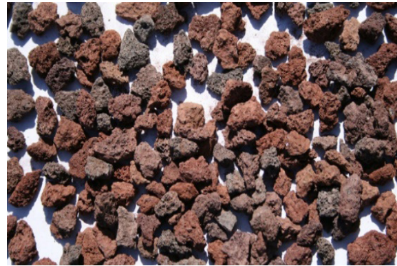
Şekil 2. Bazik Pomza ( http://www.mustafatunc.biz/pomza ).