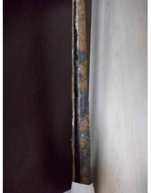
Şekil 3. Korozyona Uğramış Split-Set