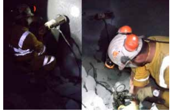
Şekil 2. Çekme Testleri

görülmektedir. Poliüre kaplamalı split-setler için ise, saplama ve delik temas yüzeyinde meydana gelen adeziv bir yenilme olmamıştır. Şekil 4'te görüldüğü gibi tüm testler çelik kırılması nedeni ile sonlandırılmıştır. Korozyondan kaynaklı yük değerlerinde düşüş yaşanmamış ve ortalama 81 kN seviyesinde çelik kırılmaları gerçekleşmiştir. Split set testlerine yönelik sonuçlar Çizelge 1'de verilmiştir.