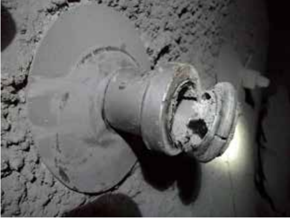
Şekil 4. Kırılmış Split-Set Çeliği