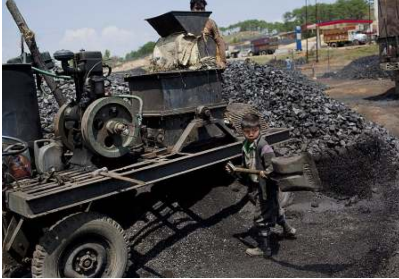
XXI. Yüzyıldan Bir Manzara