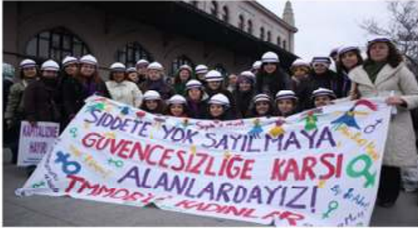
YAŞASIN KADIN DAYANIŞMASI, YAŞASIN 8 MART

Yukarıda sayıp dökülen bütün nedenlerle, TMMOB'de kadın çalışması başlatılmış; Odalar ve İKK'lar bünyesinde kadın komisyonları oluşturulmuş ve örgütümüz kadınlarınca; birincisi İstanbul, ikincisi de Ankara'da olmak üzere, iki kadın kurultayı gerçekleştirilmiştir. Gerek bu kurultaylar öncesi yerelerde yapılan çalışmalar, gerekse diğer kadın etkinlikleri, hızla artmakta ve gittikçe artan sayıda kadın çalışmalarda yer almaktadır. Haksızlıklara dikkat çeken ve güzel bir dayanışma örneği de sağlayan kadınlar, 3. Kurultay'ı Kasım/2013'te yapacak. İstanbul Çalışmayı 9 Haziran'da olmak üzere, Türkiye'deki tüm yerel çalıştaylar da bu tarihte tamamlanacak... Bu çalışmalar diğer başka örgütlere de örnek teşkil etmiştir.