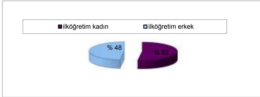
Şekil 2- İlkokul Öğretmeni Nüfusunda Kadın-Erkek Dağılımı (Kaynak: Millî Eğitim Bak.)