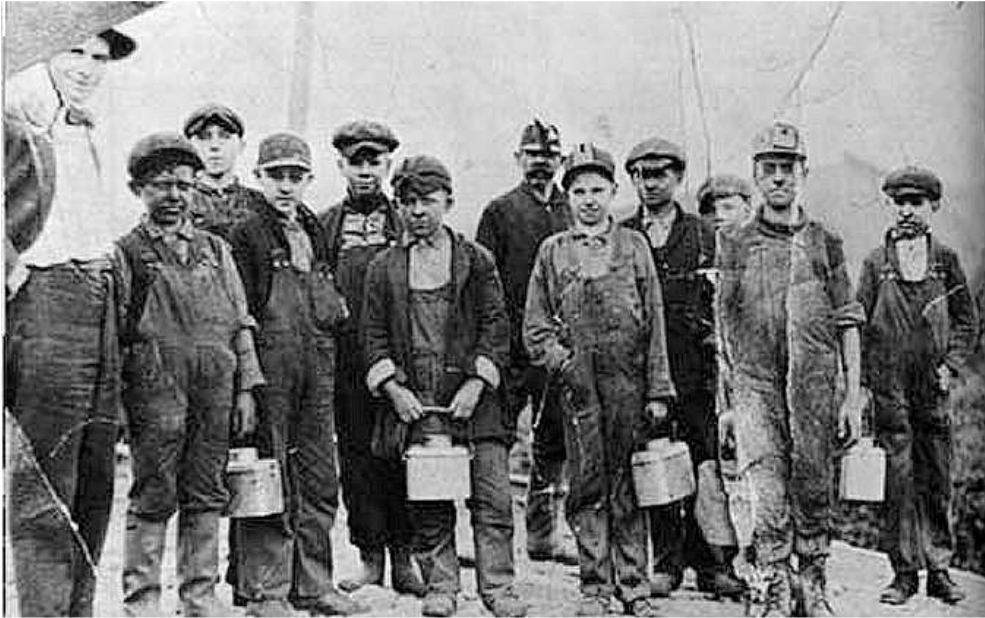
XIX. Yüzyıldan Bir Manzara