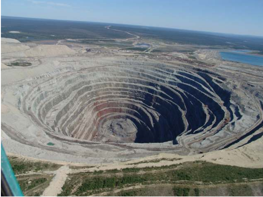
Udaçnaya Kimberlit Bacası / Yakutistan / Rusya F.