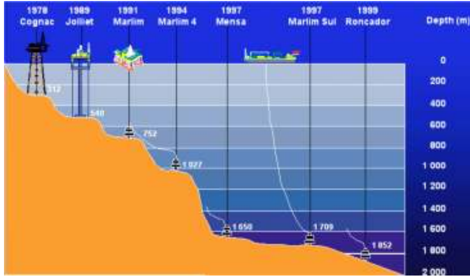
Okyanus Petrol ve Doğalgaz İstihracındaki Sermest Derinleşmenin Seyir Defteri

Günümüzün savaşları, hidrokarbon kaynaklarının paylaşımı uğruna yapılmakta, en büyük anlaşmalar enerji sektöründe imzalanmakta ve dünya ekonomisinin de enerji üzerinden yönlendirilmesi, enerji politikalarına verilmesi gereken önemi bir kez daha kanıtlamaktadır... Ülkelerin siyasi bağımsızlığı, ekonomik bağımsızlığı ile birebir ilintilidir. Günümüzde ekonomik bağımsızlık, yeterli enerji kaynaklarına sahip olmak demektir. Türkiye; enerji politikalarını –öz potansiyelini düşünmeden– bazı yönlendirmelerle belirleyip dışa bağımlılığını artmaktadır. Enerji, salt büyümeyi etkileyen bir unsur olmanın ötesinde, dünya barışı için de önemli rol oynamaktadır. Bu nedenle, WEC ( World Energy Council = Dünya Enerji Konseyi); “insanlar için enerji, barış için enerji” anlayışı ile hareket edilmesi kararını almıştır.