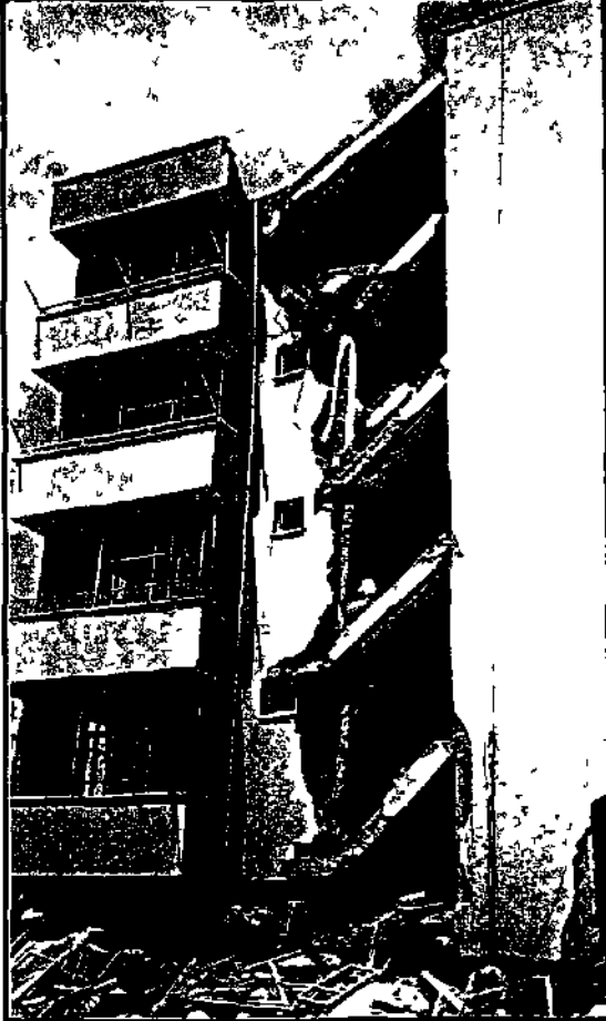
Adana - Haziran 1998

1 Ocak 1998'de yürürlüğe giren yeni Afet Yönetmeliği 'nin deprem bölgelerinde yapılacak yapılarda belirli sınıfların altında beton kullanımını yasakladığını biliyor musunuz ?