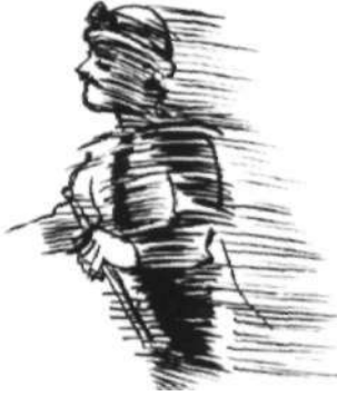
Çizim : Süleyman Bilgin

FERELERE RÜZGAR GİBİ ÇIKARIZ YEL OLUR AKARIZ BAŞYUKARILARDAN KONVEYÖRLERE EMEĞİMİZİ KOYAR VAGONLARA SEVDAMIZI YÜKLERİZ Mete Alpsar