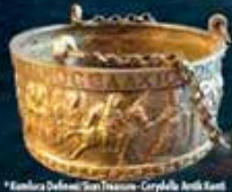
*Embara Defne: San Treasury - Crystalle Ardi Kasti

TMMOB Maden Mühendisleri Odası UCTEA Chamber of Mining Engineers of Turkey